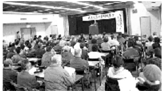
結成集会・2月26日・市民会館

境港市でも、80名を超える市民のよびかけで、2月26日、126名の市民が参加し、「境港九条の会」が発足。講演会や署名運動、Peace 9 Cafe など楽しいことも織りまぜて活動を広げています。