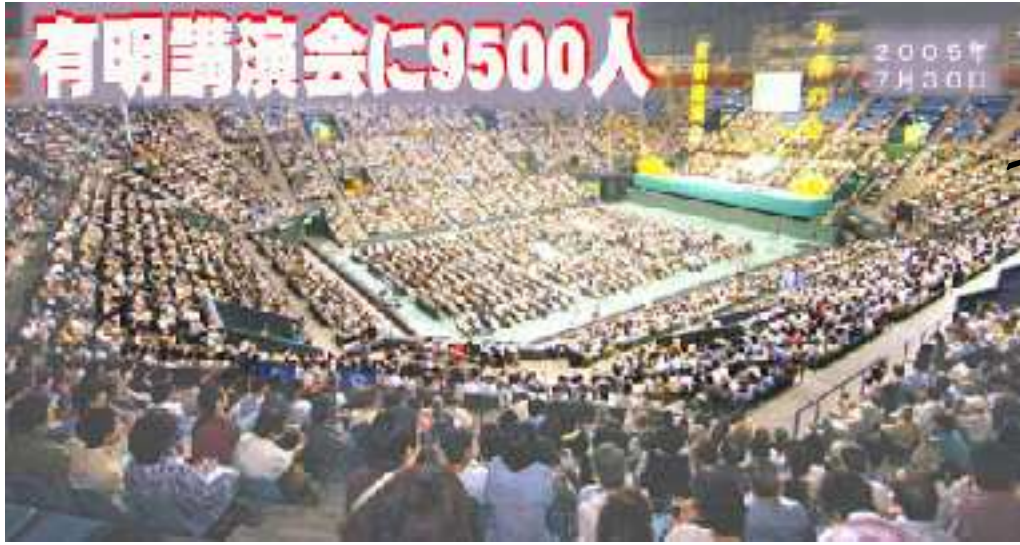
7月30日には東京・有明コロシアムで、九条の会講演会が開かれ、9500人が参加。よびかけの三木睦子、鶴見俊輔、小田実、奥平康弘、大江健三郎、井上ひさしなどが講演、また作家の澤地久枝氏もビデオで参加し、それぞれの言葉で9条を語り、参加者に、「憲法は守れる」の勇気と感動を与えました。